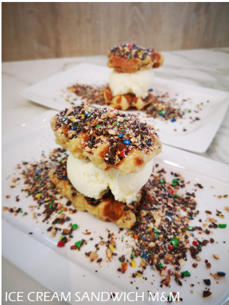
ICE CREAM SANDWICH M&M