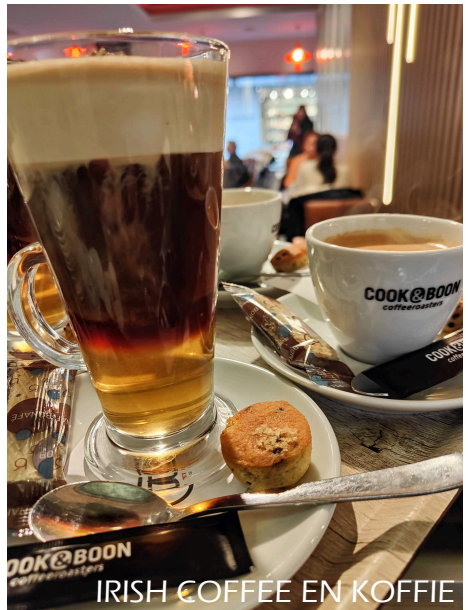
IRISH COFFEE EN KOFFIE