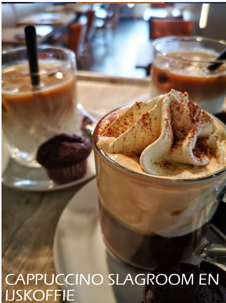
CAPPUCCINO SLAGROOM EN IJSKOFFIE