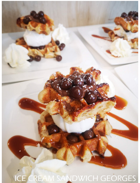
ICE CREAM SANDWICH GEORGES